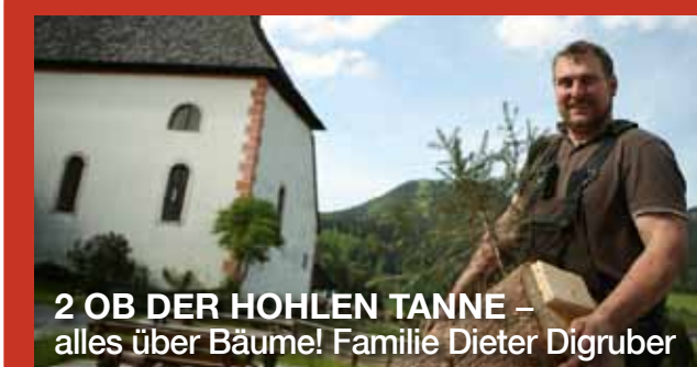
2 OB DER HOHLEN TANNE – alles über Bäume! Familie Dieter Digruber